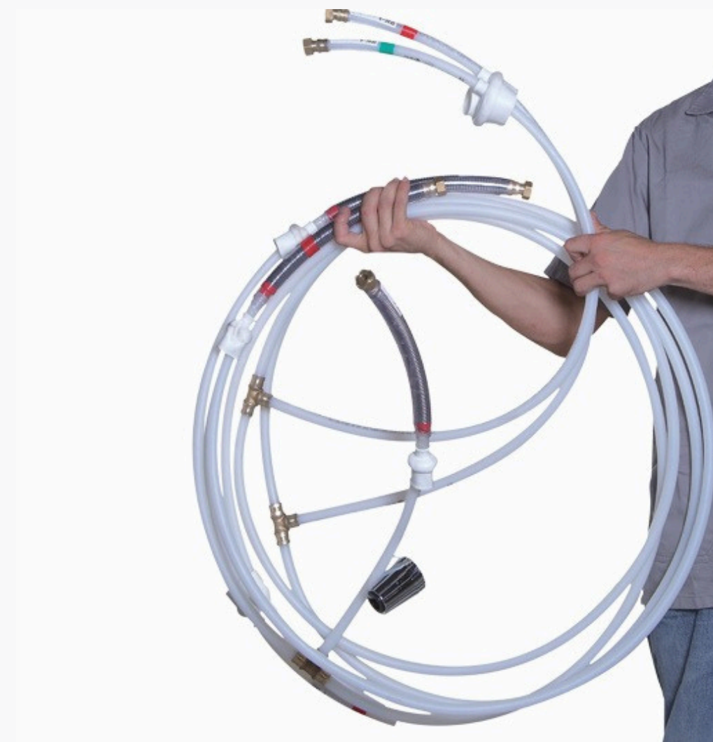
Figura 08: Chicote hidráulico

Chicote hidráulico: este componente tem como principal função realizar a distribuição de água quente e fria dentro de uma edificação. Ao receber o kit de chicote hidráulico, as tubulações já estão prontas para a instalação, que é realizada de forma prática e eficiente. As tubulações do chicote são posicionadas entre a laje e o forro, ficando protegidas e com fácil acesso para futuras manutenções. Uma característica importante é que a instalação do chicote hidráulico pode ocorrer em uma fase posterior da obra, de acordo com o planejamento do projeto.