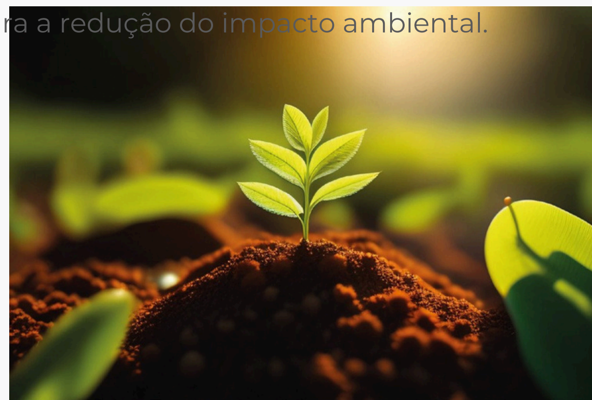
Figura 03: Impacto Ambiental

Essa lista de vantagens é longa, não é mesmo? E com a crescente demanda por projetos mais rápidos, econômicos e sustentáveis, os sistemas industrializados desempenham um papel fundamental na busca por mais inovação e eficiência no setor da construção civil.