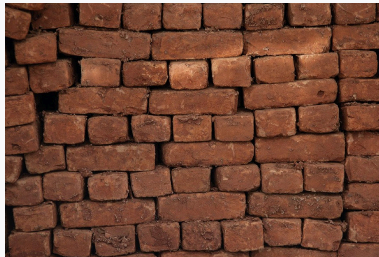
Figura 01: Tijolos antigos

A construção civil possui uma história milenar, que começa nas civilizações antigas. O uso de tijolos, como nós conhecemos hoje, teve início por volta de 7.000 a.C. na Turquia, com os tijolos adobe, marcando o primeiro registro de construção com esse material. Os tijolos adobe, feitos de barro e palha, eram secados ao sol e empilhados para formar paredes resistentes. Mais tarde, por volta de 3.000 a.C., o Oriente Médio introduziu os tijolos cozidos, que passavam por um processo de queima para aumentar sua durabilidade e resistência. Esses avanços no uso de tijolos foram fundamentais para o desenvolvimento das técnicas construtivas ao longo dos séculos.