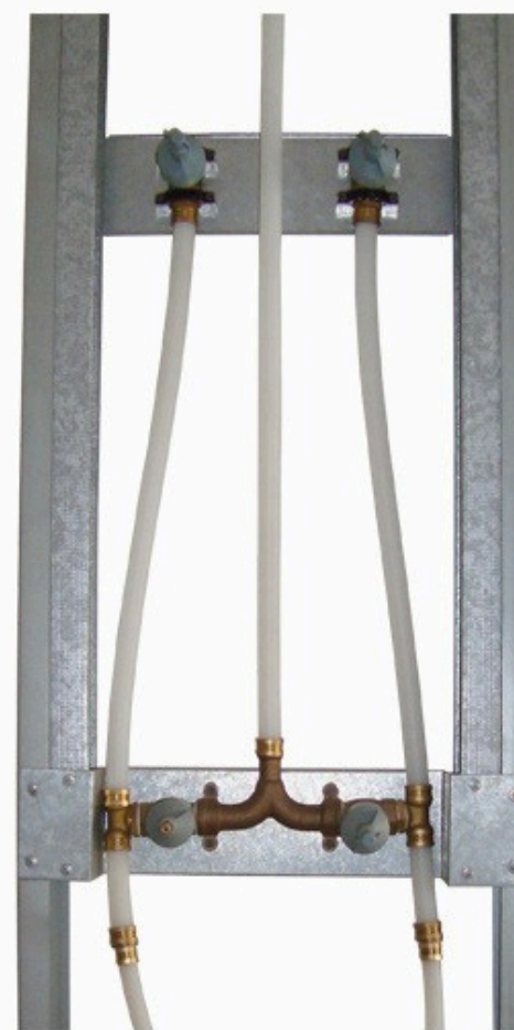
Figura 09: Chassi metálico hidráulico

Chassi metálico hidráulico: Trata-se de uma estrutura metálica pré-fabricada projetada para posicionar e sustentar os registros de chuveiro, garantindo a estabilidade e resistência necessárias durante o uso. A instalação do chassi metálico hidráulico é realizada de forma cuidadosa e precisa. A estrutura é posicionada de acordo com o projeto e fixada adequadamente à estrutura da edificação.