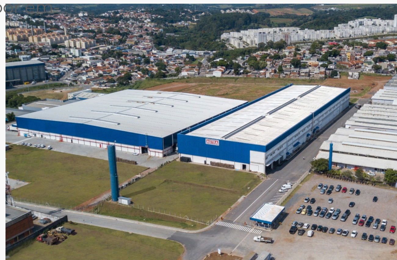
Figura 04: Uma das unidades fabris da Astra

Elas são responsáveis pela fabricação dos componentes, kit hidráulico industrializado, shaft modular e passante corta fogo, entre outros, de acordo com as especificações do projeto. Além disso, essas empresas também podem executar serviços de projeto, engenharia e consultoria para auxiliar na implementação dos sistemas em obras de construção.