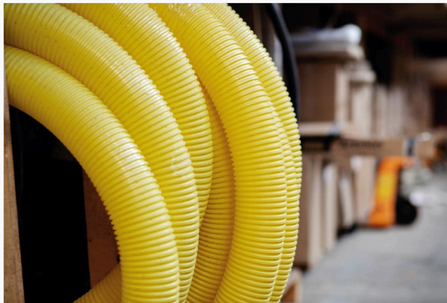
Figura 06: Almoxarifado

Os kits de sistemas industrializados são utilizados de forma eficiente e estratégica durante a execução da obra. Logo no recebimento, os kits são encaminhados ao almoxarifado de acordo com o planejamento prévio estabelecido, o que permite uma redução na quantidade de materiais estocados. Isso contribui para uma melhor organização e otimização do espaço no canteiro de obras.