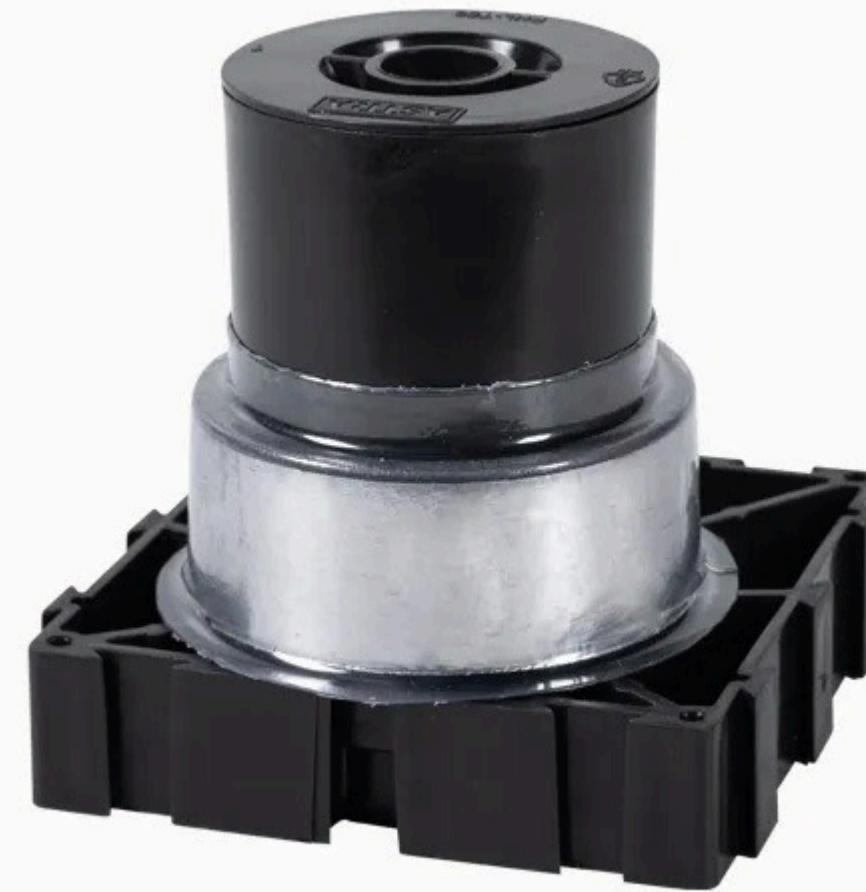
Figura 12: Passante corta fogo

Lembre-se de seguir as normas técnicas e contar com profissionais capacitados para garantir a segurança e eficiência da instalação.