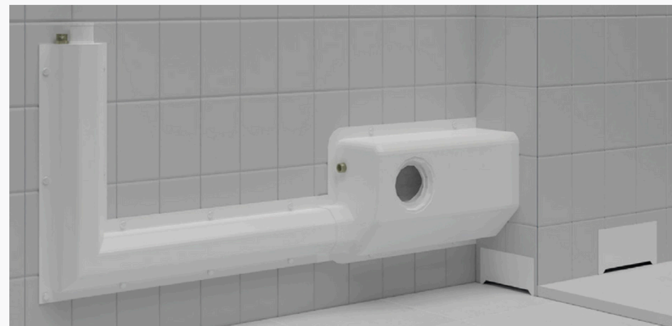
Figura 11: Shaft Modular

A instalação do kit Shaft ocorre durante a construção da edificação. O kit é posicionado no local designado para o shaft, que é o espaço reservado para a passagem de tubulações, como as de água, esgoto, elétrica, entre outras. Com o auxílio do kit Shaft, os profissionais responsáveis pela instalação conseguem identificar com precisão onde as tubulações devem ser conectadas, agilizando o processo e evitando erros de posicionamento.