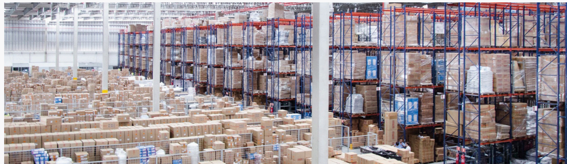
Figura 05: Armazenamento da ASTRA

Um dos principais diferenciais da ASTRA é o seu compromisso com a qualidade, assegurando que todos os seus produtos atendam a rigorosos padrões de excelência. A empresa possui uma logística integrada eficiente, garantindo a entrega dos materiais no prazo estabelecido.