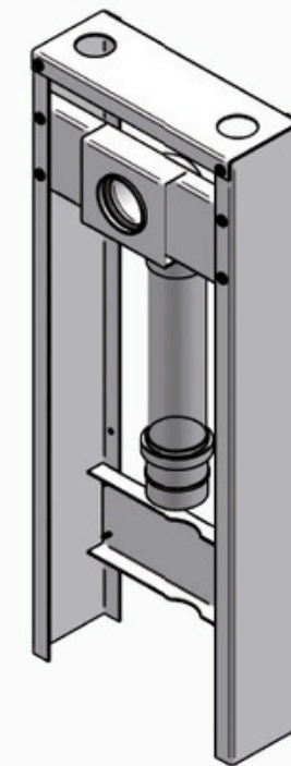
Figura 10: Chassi de esgoto

etapa, é feita a marcação dos furos e o chassi é fixado na parede. A carenagem é então encaixada no chassi, proporcionando um acabamento estético ao conjunto. Por fim, a instalação é finalizada, garantindo que as tubulações de esgoto estejam devidamente posicionadas e suportadas.